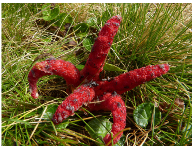
Anthurus étoilé

L'Anthurus étoilé et le Clathre rouge sont deux curiosités introduites dans notre flore fongique. Si le premier est probablement arrivé en Europe dans des cargaisons de laine en provenance d'Australie, le second a vraisemblablement été introduit avec du matériel végétal issu de la région méditerranéenne. Aucune propriété invasive n'est connue chez ces deux espèces de champignon. Les études scientifiques étant à ce sujet quasi inexistantes, il importe de bien observer et documenter leur propagation.