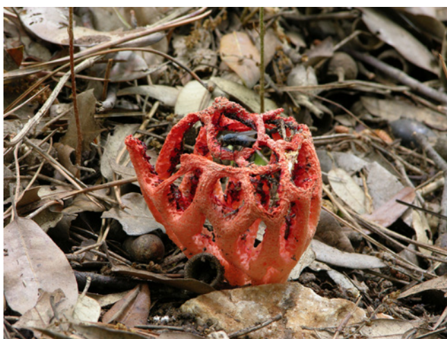
Clathre rouge

Grille de 5 x 5 km: Clathrus ruber Micheli ex Pers.