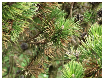
Fig. 2: Les branches proches du sol sont les premières atteintes.

En cas de forte atteinte, les aiguilles les plus jeunes peuvent aussi être infectées. Les conidies se répandent par temps chaud et humide . Elles sont disséminées par les aérosols , les éclaboussures et les gouttes de pluie .