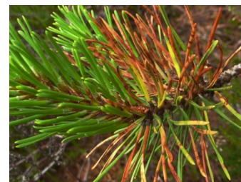
Fig. 3: La génération d'aiguilles fraîchement débouffées n'étant pas encore infectée, elle se démarque clairement.