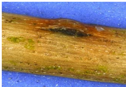
Fig. 1: La fructification noire au milieu de la bande rouge se soulève de l'épiderme

Le nom commun «maladie des bandes rouges» fait référence aux symptômes suivants: