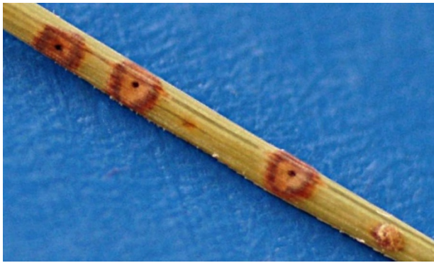
Fig. 4: Les taches brunes peuvent aussi être provoquées par des insectes, dont le trou de forage au centre de la tache se distingue clairement.

L'infection des aiguilles des pins commence entre mai et juin, pendant des périodes pluvieuses. Elle peut se poursuivre durant l'été jusqu'au début de l'automne. Les spores asexuées (conidies, fig. 5) du champignon sont disséminées avec les gouttes de pluie. Elles germent à la surface de l'aiguille et s'y introduisent en passant par les stomates. La maladie se propage donc uniquement par temps humide. Le champignon subsiste en hiver dans les aiguilles mortes (sur l'arbre ou au sol).